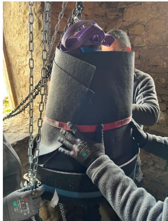
Bilder 1 und 2: Eine Kranbahn wird an der Dachkonstruktion befestigt. Um die Glocke vor Beschädigungen zu schützen, wird sie mit Flies ummantelt.