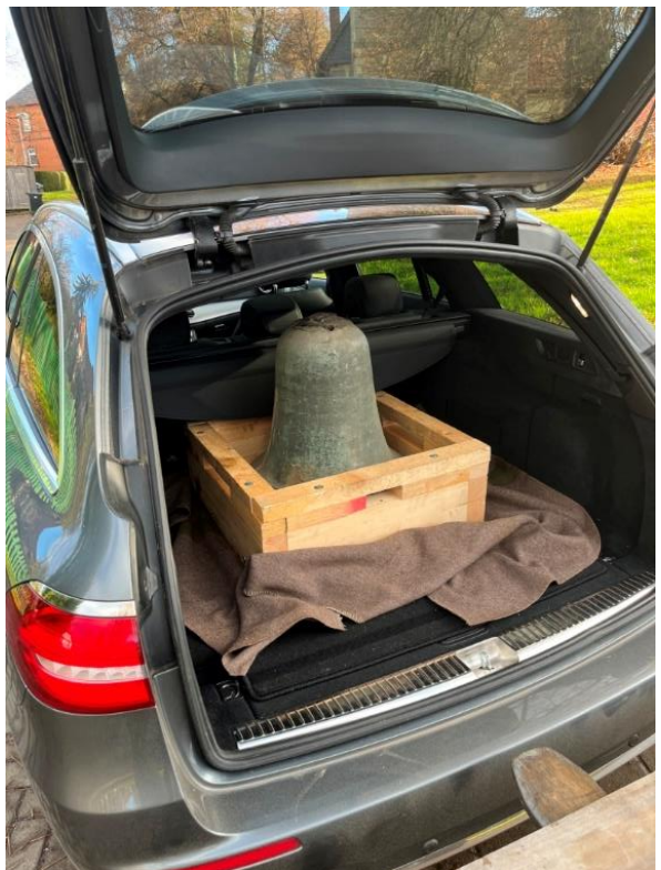
Bilder 5 und 6: Im PKW wird die Glocke in ihrer Transportbox in die Glockengießerei nach Asten transportiert, wo sie zunächst gewogen wird (108 kg).