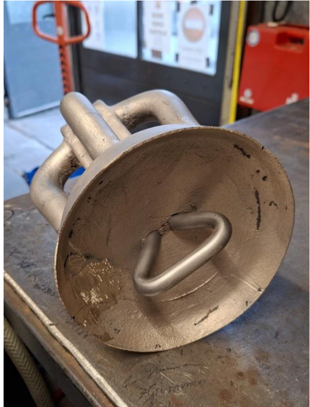
Bilder 9 und 10: Die neue Krone mit Halterung für den Klöppel