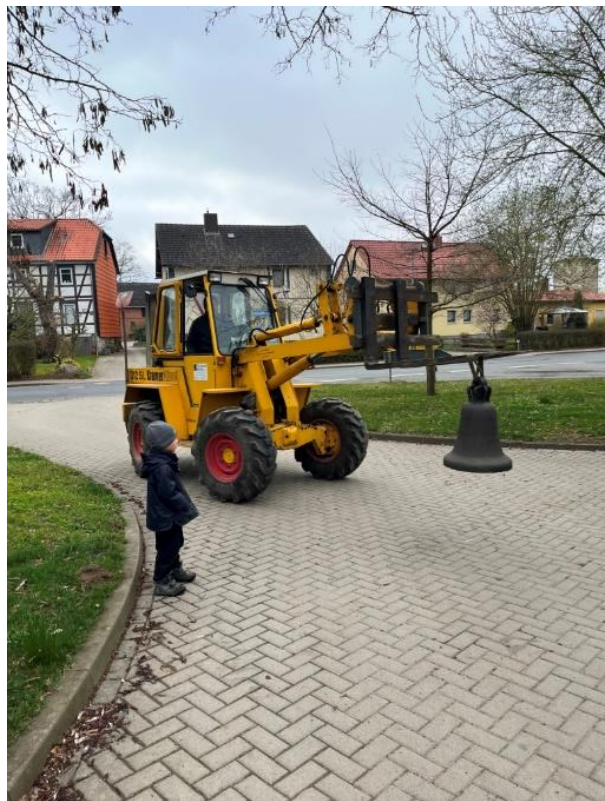
Bilder 12 und 13: Firma Scherler liefert die Glocke an. Mit der Radlader wird die Glocke zum Kirchturm transportiert.