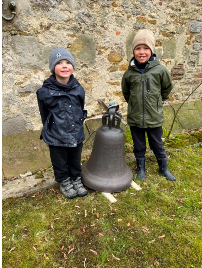
Bild 14: Wegen der neuen Krone ist die Glocke höher geworden, so daß die Transporteinrichtungen im Turm angepaßt werden mußten.