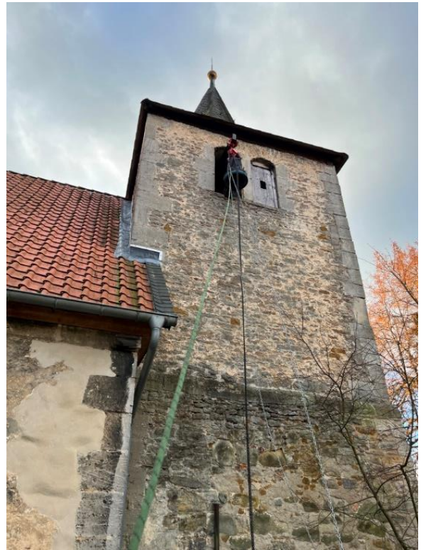
Bilder 3 und 4: Die Glocke wird mittels Kranbahn aus der Turmöffnung geführt und mit Hilfe von Kettenzügen herabgelassen.